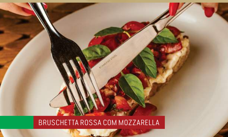
BRUSCHETTA ROSSA COM MOZZARELLA