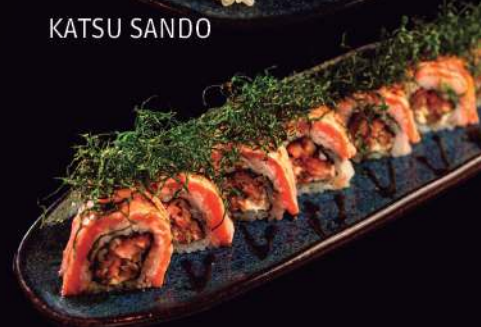
URAMAKI SALMÃO CROCANTE