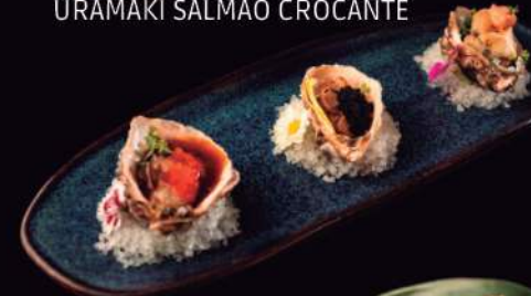
TRIO DE OSTRAS